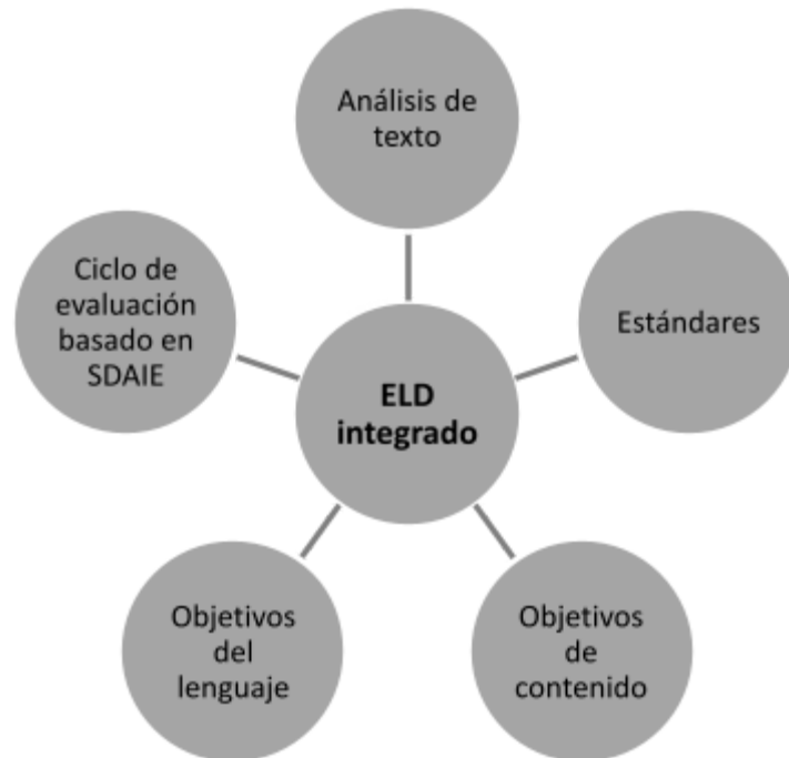
Figura 1: Los componentes del ELD integrado

maestros brindan instrucción ELD integrada efectiva que se caracteriza por: